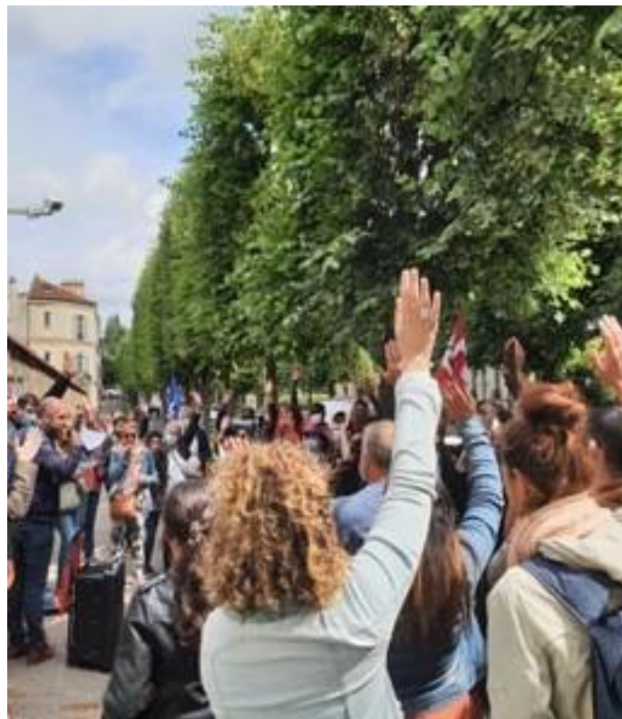
Rassemblement à Versailles pour le réemploi de tous les contractuels

La FNEC FP-FO exige le réemploi et la titularisation de tous les personnels contractuels qui le souhaitent.